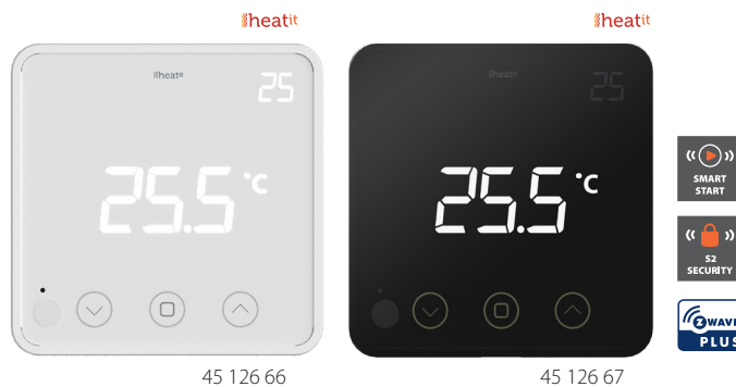
HEATIT Z-TEMP2 Hvit RAL 9003